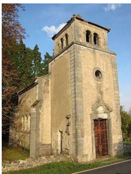
La chapelle de Regniéville

Thiaucourt, gardien de 20000 tombes de toutes nationalités, est aujourd'hui une des plus grandes nécropoles militaires de France et possède l'un des plus beaux cimetières militaires américains d'Europe.