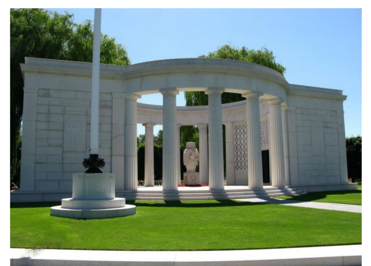
Le cimetière américain