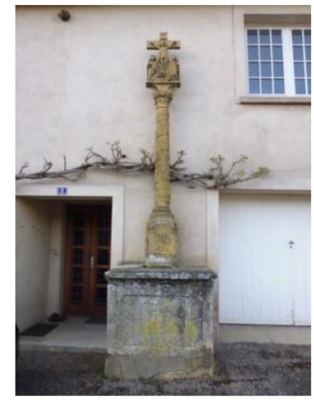
Croix de la place du village

D'or à trois pals au pied fiché de gueules au chef de même chargé de trois tours d'or.