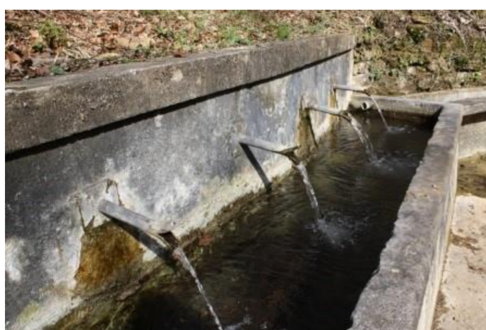
Fontaine des Trois-Goulots ou Pütter=Quelle