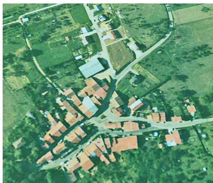
Villers lès Moivrons vu du ciel

Cette commune est annexe de Moivron. Patron, Saint Gengoult.