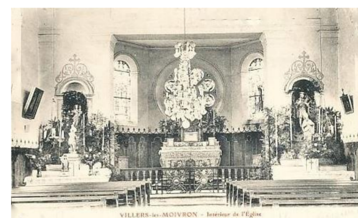
Intérieure de l'église