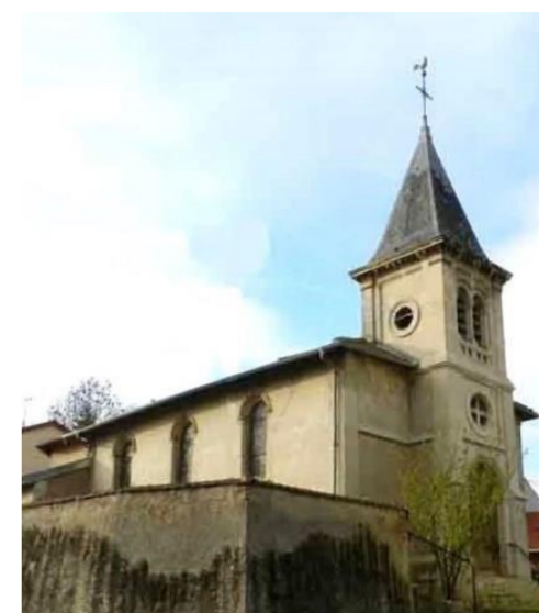
Eglise Saint Gengoult

D'azur au sautoir d'argent à la bordure d'or.