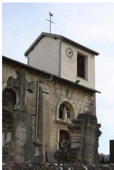
Eglise Saint Blaise

Les armes ducales nous indiquent que le duc de Lorraine était seigneur du lieu. La paroisse dépendait de l'abbaye de Sainte Marie aux Bois, d'où le M antique et les étoiles. Pour respecter le nom de la commune ? l'ensemble des deux blasons se trouve sous celui de Prény, qui représente une tour. La commune utilise ce blason depuis décembre 1985.