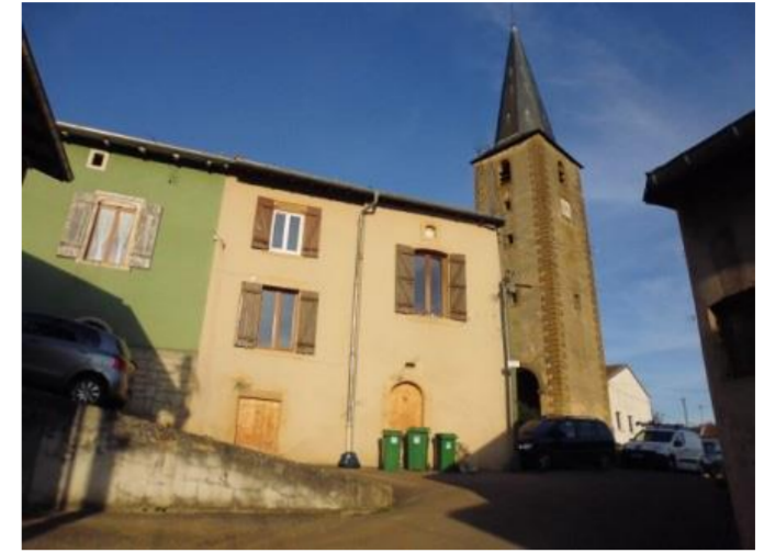
Rue de l'Église

D'azur, à un Saint-Gorgon à cheval armé de pied en cap et terrassé d'or, au chef de gueules chargé de trois grappes de raisin feuillées d'argent.