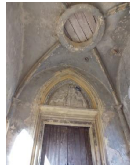
Portail de l'église

Arrondissement: Briey Canton: Chambley-Bussières Pont-à-Mousson (2015) Code Insee: 54 593 Code postal: 54 890 Population: 435 habitants Superficie: 11,43 km 2