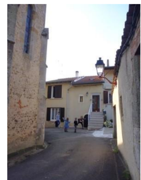
Vestiges de l'âtre fortifié