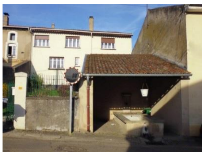
Lavoir, rue de Joyeuse